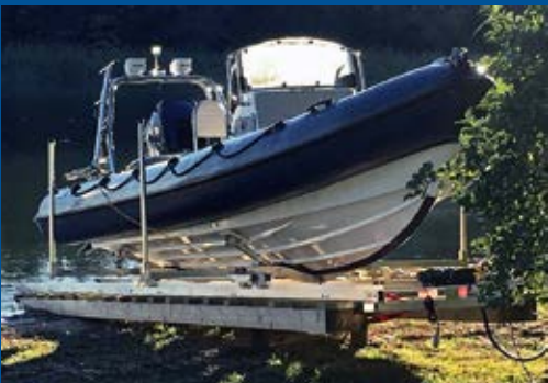
Suuri telakka 15 m, sähkövinssi, vene 1500 kg

alutrack MODERN ALUMINIUM RAILLIFT FOR BOATS