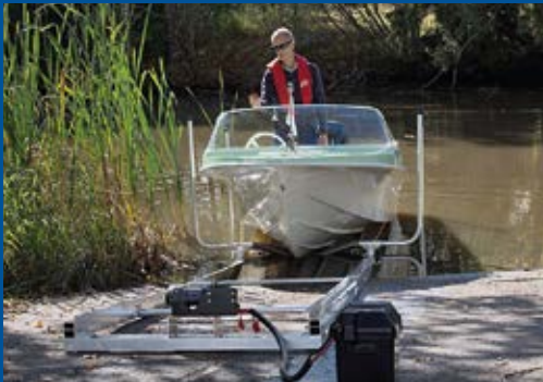
Kevyt telakka 10 m, sähkövinssi, vene 450 kg