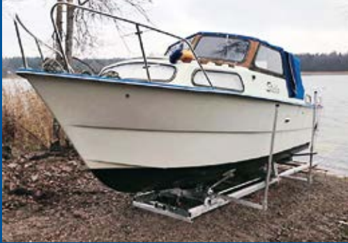
Suuri telakka, 20 m, sähkövinssi, vene 2100 kg