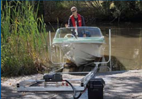
Kevyt telakka 10 m, sähkövinssi, vene 450 kg