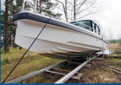
Suuri telakka, 20 m, sähkövinssi, vene 2500 kg

Hinnat vapaasti tuotannostamme (alv 24 %)