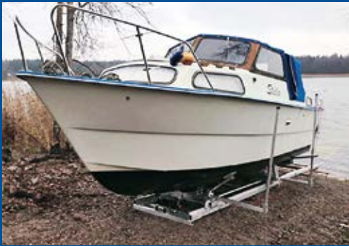
Suuri telakka, 20 m, sähkövinssi, vene 2100 kg