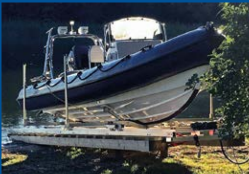
Suuri telakka 15 m, sähkövinssi, vene 1500 kg

alutrack MODERN ALUMINIUM RAILLIFT FOR BOATS