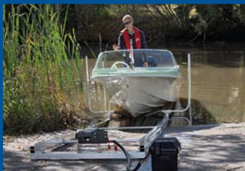
Lätt slip, 10 m, elvinsch, båt 450 kg