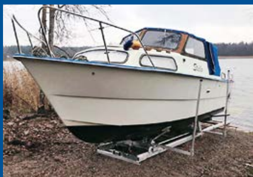
Stor slip, 20 m, elvinsch, båt 2100 kg