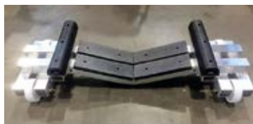
Extra sidostöd för aktervagn