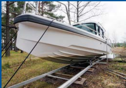
Stor slip, 20 m, elvinsch, båt 2500 kg